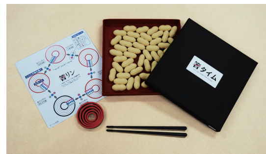
「箸タイム」が好評発売中